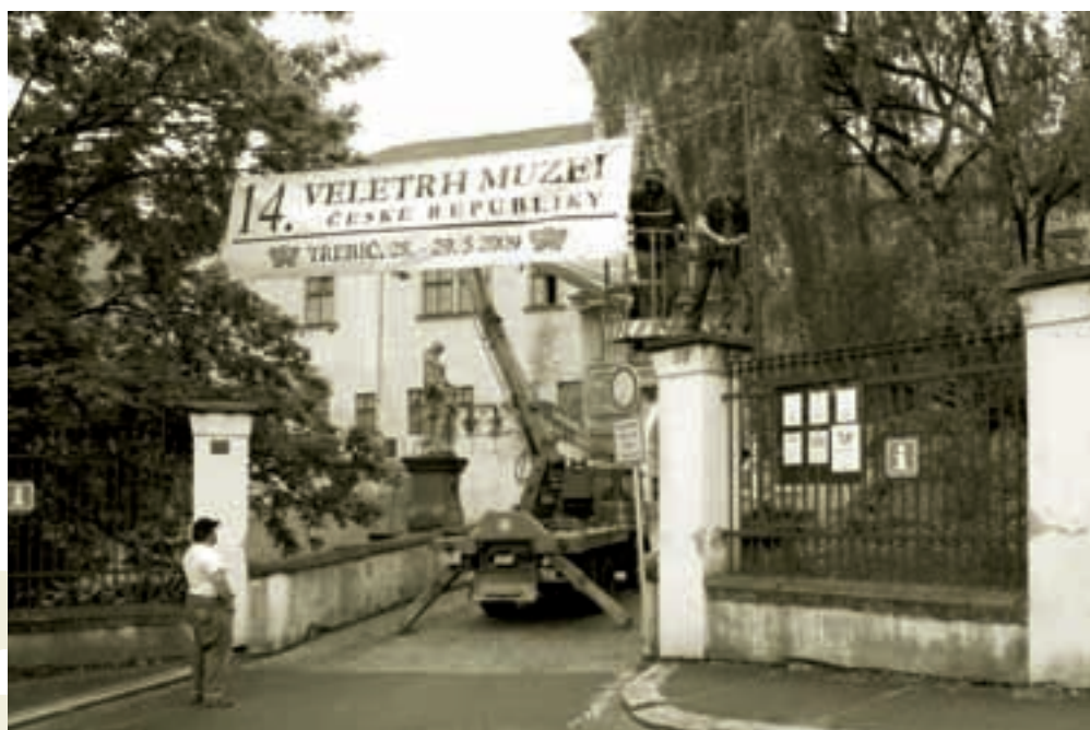
Vzpomínka na loňský ročník v Třebíči