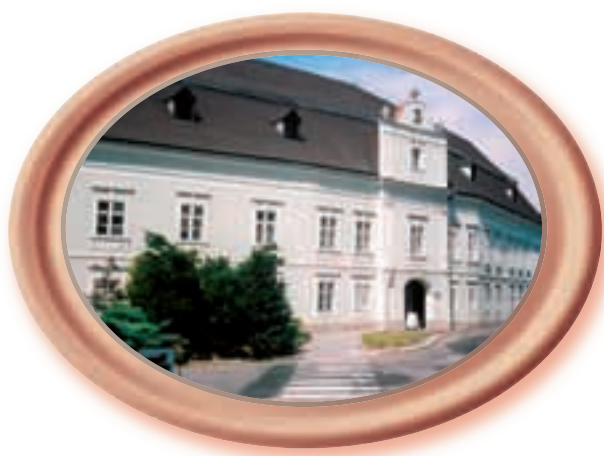
Muzeum řemesel Moravské Budějovice