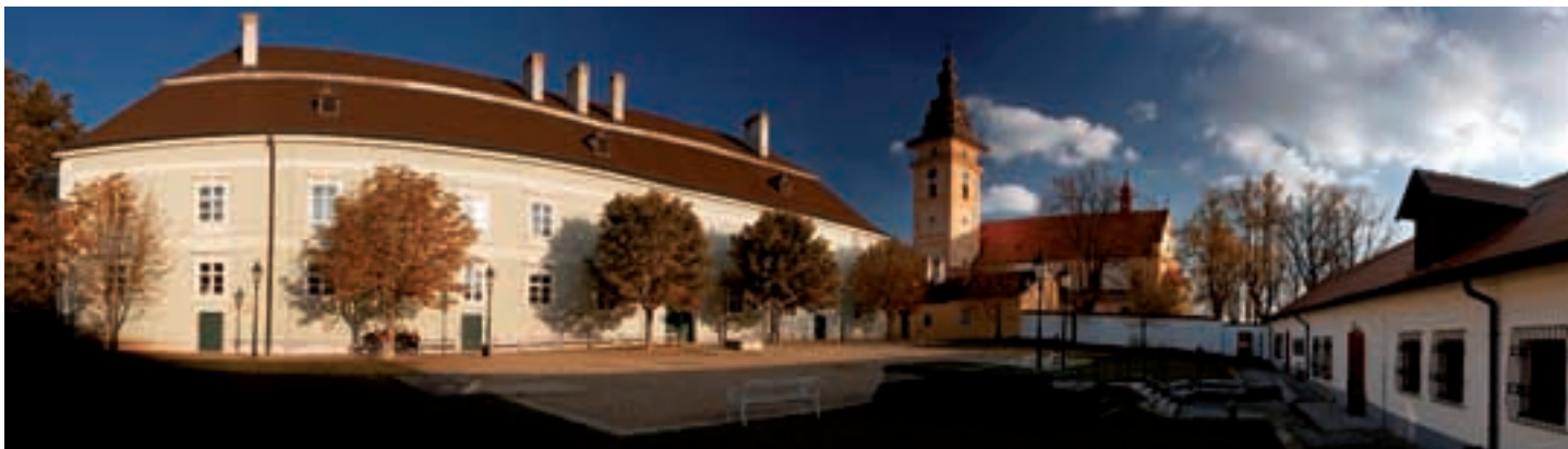
Zámek v Moravských Budějovicích - sídlo Muzea řemesel Moravské Budějovice.